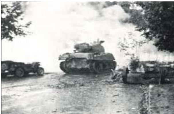
Танк третьей армии преодолевая завалы уничтоженной немецкой техники, пробивает себе путь в Париж сквозь дым сражения.

Я был старшим сержантом и находился во Франции с самого начала её освобождения, мне было 33 года. Я служил в 4-м вооружённом дивизионе, в роте «А» 704-го противотанкового батальона, который был частью третьей армии генерала Паттона. 17 ноября танк, в котором я ехал, был подбит немецким танком и мы с механиком-водителем получили серьёзные ранения.